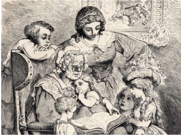
© Frontispice de Gustave Doré. Edition Hetzel, 1867. BML